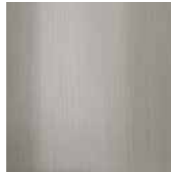
Edelstahl gebürstet brushed stainless steel