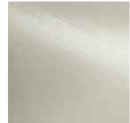
Nickel matt nickel matt